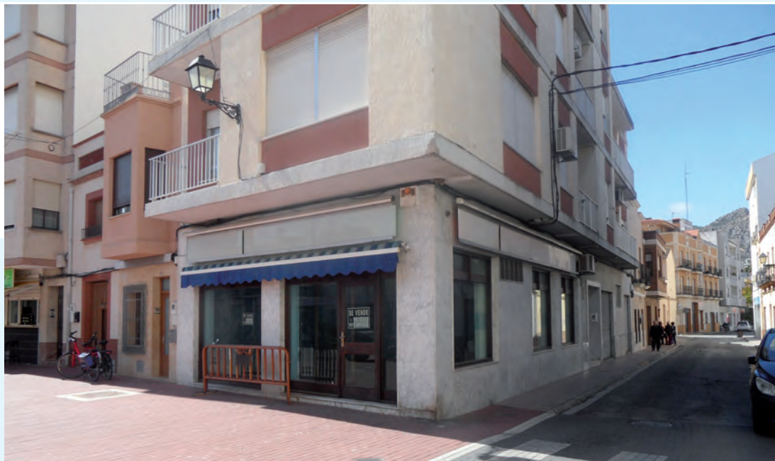
Aquí estuvo la sucursal de la Caja Provincial

quienes abría cuentas en Denia, para después trasvasarlas tras la apertura formal. El local hoy permanece cerrado, aunque el soporte de su rótulo es inequívoco. Tras la fusión, a primeros de los años 90, la oficina se integró en la de CAM.