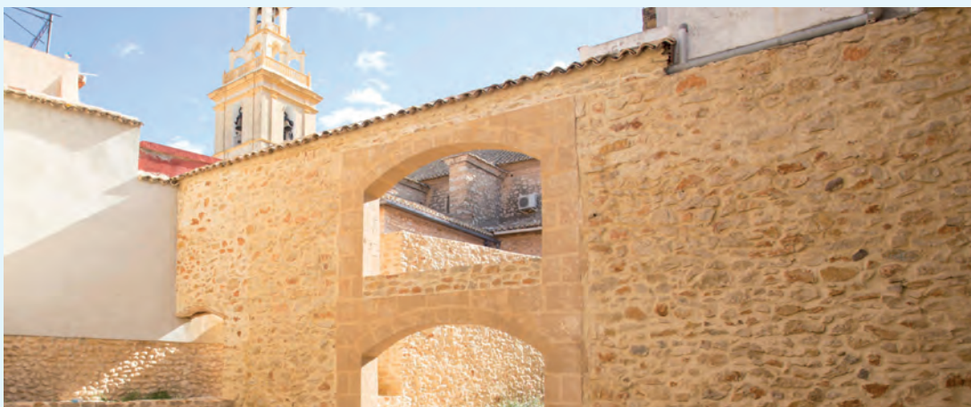
Casa de la Senyoreta

La Casa de la Senyoreta de la Bassa es un edificio de principios del siglo XX que linda con la iglesia. De planta baja y dos pisos, fue concebido como vivienda y en la actualidad se encuentra en proceso de restauración para albergar un museo