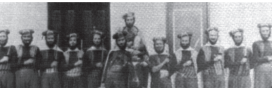
Primera filà mora de San Blas.