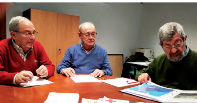
Miembros del Jurado