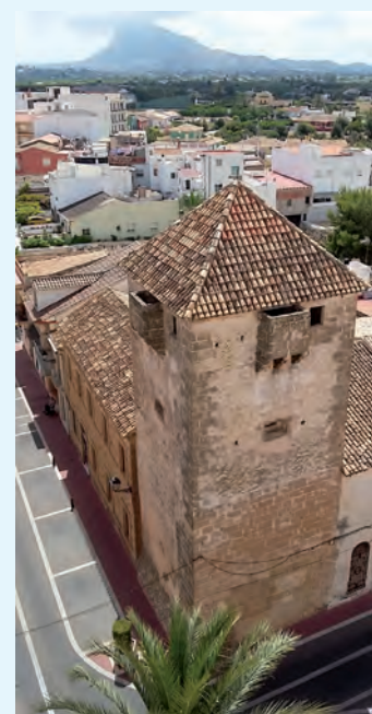
Torre del Comendador