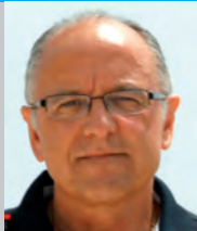
Rafael Olivares Seguí

TENSIÓN EN LA CALLE.- Las principales avenidas estaban a rebosar. En las últimas horas de la tarde, ya anocheciendo, familias enteras deambulaban por aceras enmoquetadas de rojo ante comercios engalanados con luces, abetos y espumillón, realizando las compras propias de cada diciembre. Las músicas navideñas de unos locales pugnaban con las de otros por hacerse notar. En las esquinas, numerosos Papás Noel tañían sus campanillas y repartían globos y golosinas entre los más pequeños. A la hora exacta, todas las luces se apagaron, cesó cualquier sonido y hasta los Santa Claus guardaron sus instrumentos. Un estridente silencio se adueñó del ambiente. Dos potentes focos hicieron converger sus haces de luz sobre Giacomo Pochetino que, a ciento cincuenta metros del suelo, en una azotea, se disponía a cruzar entre dos edificios por un cable de acero, subido a un monociclo y con una barra metálica entre las manos. La gente, absorta, mantenía la respiración con el corazón sobrecogido. Giacomo, después de saludar, se puso en movimiento lentamente gestionando el equilibrio en función de las cambiantes pautas de un leve balanceo. Al llegar justo a la mitad, el volatinero se iluminó como un árbol de Navidad, empezó a chisporrotear y liberó una cascada de partículas refulgentes. Desde allá abajo, el público, arremolinado en calles y plazas, aplaudía y vitoreaba entusiasmado. Muy pocos se dieron cuenta de que un extremo de la barra acababa de rozar una línea de alta tensión.