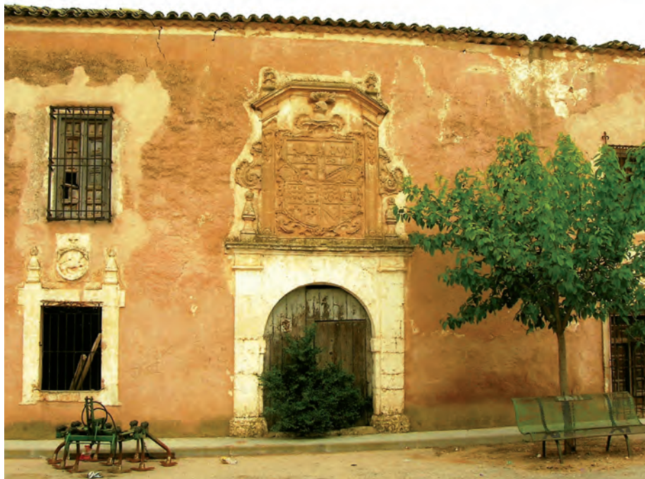
1 er Premio