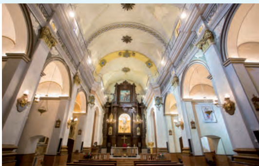
Iglesia dedicada a la Mare de Déu del Roser

con dos troneras, y en la cuarta, con cuatro matacanes.