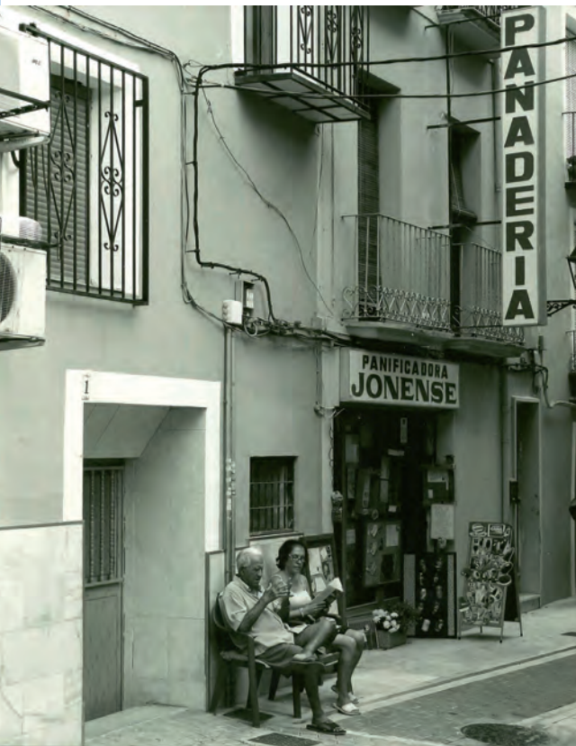
2 do Premio