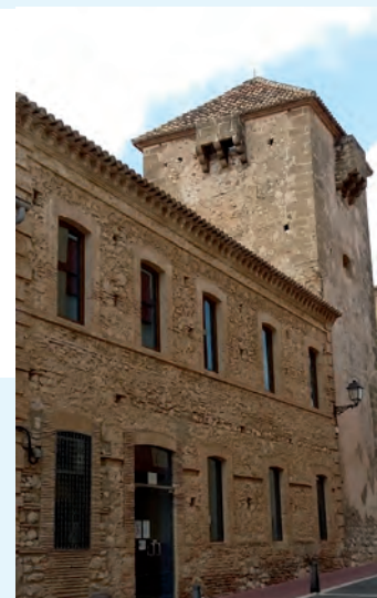
Palaco de los duques de Medinaceli

Y, por último, el “Camino del Alba” , nueva ruta del Camino de Santiago que, partiendo de la parte más oriental de Xàbia, pasa por nuestro municipio para continuar hasta Almansa, donde enlaza con la “Ruta de la Lana” para después, en Burgos, continuar por el Camino Francés hasta Santiago.