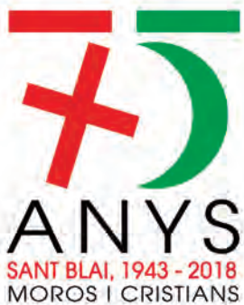
Logotipo del 75 aniversario diseñado por Luis Amat