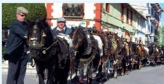
Sant Antoni ▼