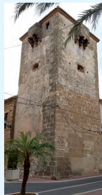
Torre del Comendador