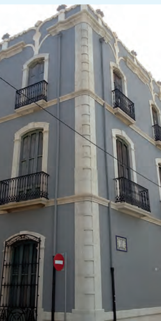
Casa de la Senyoreta

El Verger tiene unos orígenes inciertos debido a un incendio en su iglesia y, en consecuencia, la desaparición de importantes documentos sobre su historia. Incluso se tienen diferentes interpretaciones o versiones.