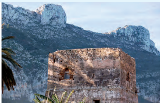
Torre de Cremadella

etnológico, una biblioteca de archivo así como nuevos espacios para usos culturales y vecinales.