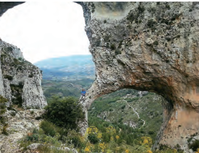
3 er Premio