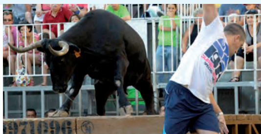
Bous al carrer ▲