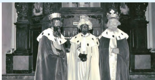
Reyes magos ▲