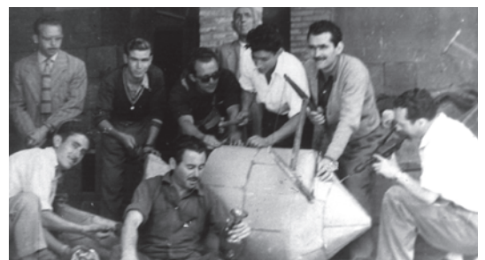
Construcción del primer castillo de Fiestas en 1948.