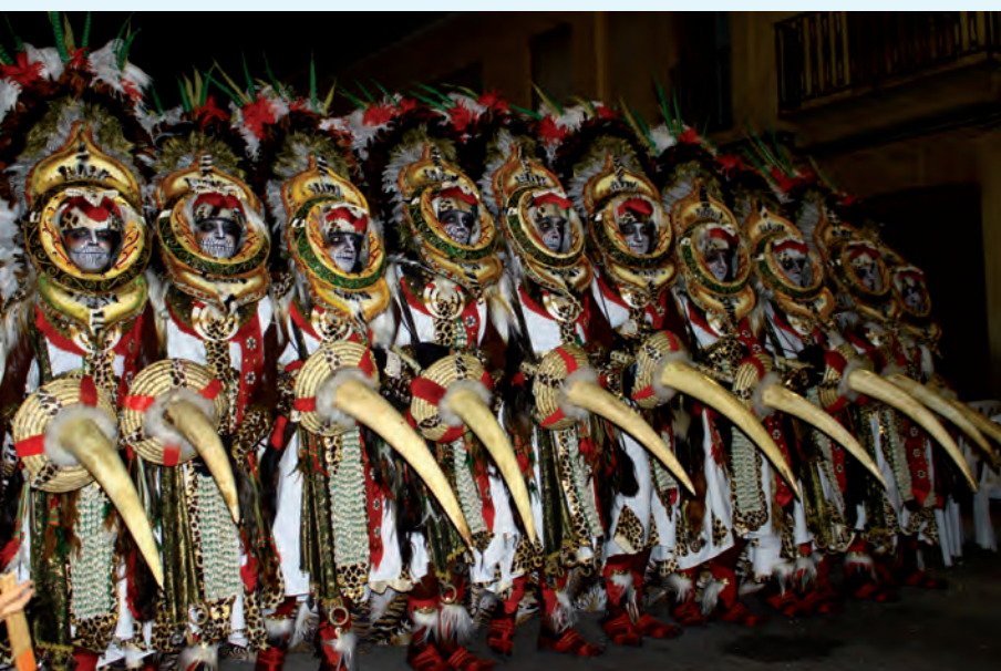
Moros y Cristianos

La Comissió de Reis El Verger es una asociación cultural que se encarga de organizar